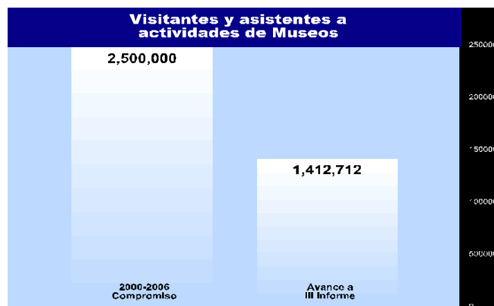
Gráfica 2

El Museo de la Alhóndiga de Granaditas, que se administra de manera compartida con el Instituto Nacional de Antropología e Historia, efectuó también una importante labor de difusión artística y cultural. Entre las actividades realizadas destacan las efectuadas con motivo de la celebración del 250 aniversario del natalicio de Don Miguel Hidalgo.