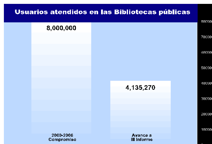
Gráfica 4

También en coordinación con autoridades federales y municipales, se establecieron 7 nuevas bibliotecas. De esta manera, la Red Estatal de Bibliotecas Públicas se elevó a 113. El número de usuarios en todo el estado fue de 1 millón 329 mil 677, quienes consultaron 1 millón 996 mil 104 volúmenes.